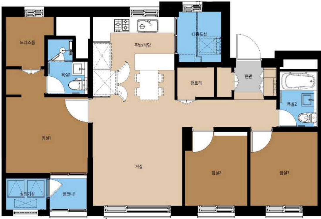
59A형 단위세대 평면도

※ 아래의 평면도는 이해를 돕기 위한 사전안내 자료이며, 설계변경 및 본 공고시 변경될 수 있습니다.