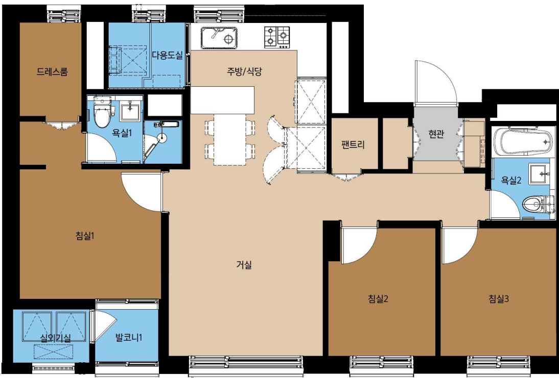
59B형 단위세대 평면도