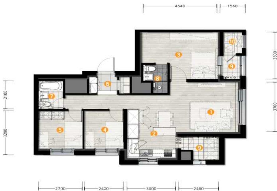
[ 59B형 ]