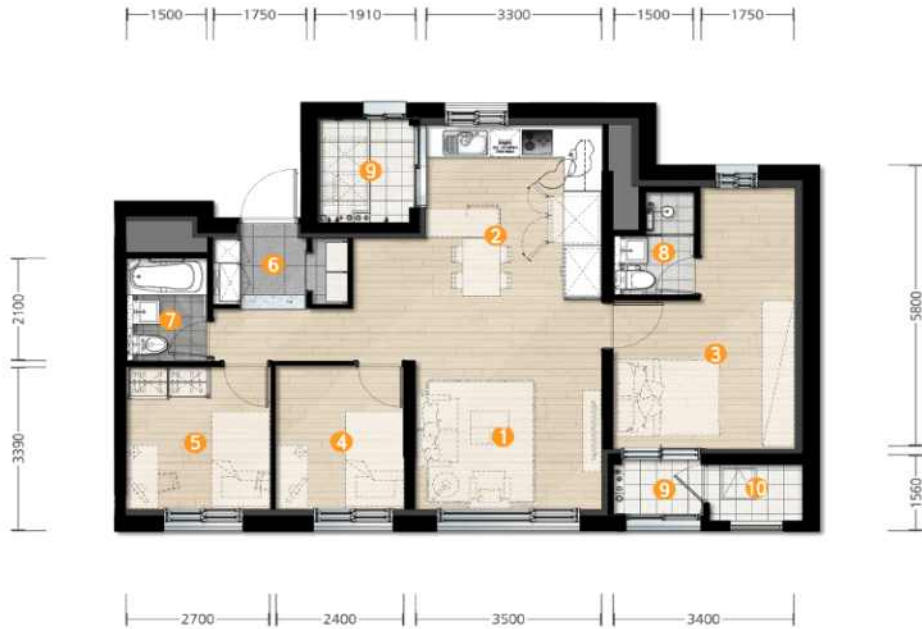
[ 59A, 59A(E)형 ]

※ 신청 전 반드시 입주자모집공고 및 팸플릿을 통해 확정된 평면도를 확인하여 주시기 바랍니다.